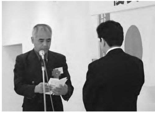
謝辞を述べる被表彰者

本事業は、毎年会員事業所から推薦された、優れた従業員や、発明・業務向上など企業の発展に貢献した従業員を表彰する制度である。今年度は29事業所69名の方々が表彰され、その労を讃えた。榊原会頭は被表彰者の今後の繁栄と健康を祈念し、祝福の言葉で結んだ。